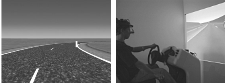
Figure 3. Le simulateur de conduite permet de générer en temps-réel la scène visuelle correspondant au déplacement du conducteur dans l'environnement routier. Le simulateur inclut un retour sonore spatialisé et un retour d'effort sur le volant. À gauche, la scène visuelle correspond à une situation de prise de virage. Le point de corde est représenté, en temps réel, par la borne blanche. Il est un indicateur direct de la qualité de la trajectoire. À droite, photo du dispositif expérimental. Noter le système de mesure des mouvements oculaires, sur la tête du sujet. Le système développé permet de recalibrer la direction du regard du conducteur dans la scène visuelle.