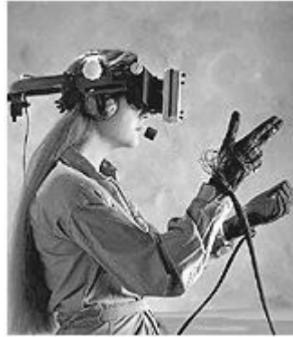
Figure 1. Le système VIVED . Le sujet est immergé dans in monde interactif, qu'il perçoit grâce à un casque de visualisation permettant une vision stéréoscopique de l'environnement virtuel et à un son spatialisé, et dans lequel il agit grâce à des "gants de données" qui mesurent les positions des segments de sa main et de sa main dans l'espace.

missions spatiales, et la visualisation intensive de données dynamiques tridimensionnelles (Foley & Van Dam, 1982).