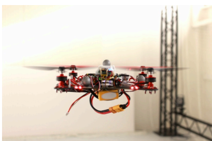
Figure 1 : Photo du drone miniature de 330 grammes X4-MaG développé au laboratoire. (Manecy et al. 2014, IEEE IROS, Soumis)

Une autre partie du travail de l'étudiant sera expérimentale : mise en œuvre et test du drone, mesures des performances. L'étudiant bénéficiera aussi d'une grande salle dédiée à l'expérimentation en robotique aérienne avec la possibilité de localiser les robots en temps réel par le système VICON de capture du mouvement.